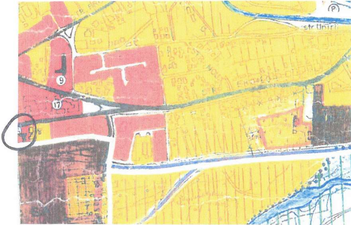
Imagine PUG anii 2000

- Daca urmarim evolutia dezvoltarii acestei portiuni de oras, constatam ca zona studziata de documentatia de urbanism a continuat, de-a lungul timpului, exclusiv functiuni din sfera industriei si serviciilor conexe acesteia. Astfel, urmarind planurile din anii 1990-2000, precum si planul urbanistic general al orasului la vremea respectiva, PUG din 2018 sau alte obiective dezvoltate recent in zona, constatam ca zona a fost in tot acest timp reglementata ca fiind zona de industrie sau servicii. Chiar amplasamentul societatii contestatare este figurat ca fiind cantina IF, deci facand partea din serviciile conexe industriei.